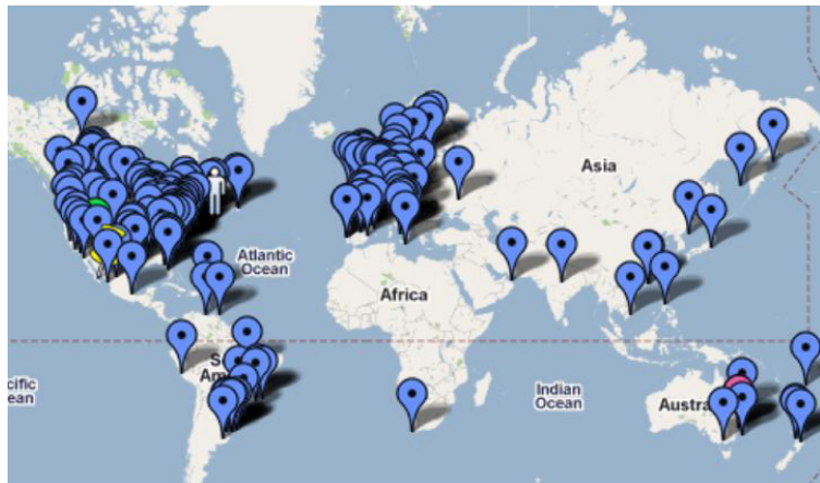
ציור 2. מפה חלקית של משתתפי PLENK2010

PLENK2010 החל בספטמבר 2010 כקורס מפר"ש בן עשרה שבועות, שארגנו במשותף מועצת המחקר הלאומית של קנדה, מכון המחקר לידע עתיר טכנולוגיה (TEKRI) באוניברסיטת אטאבסקה (Athabasca) והאוניברסיטה של אי הנסיך אדוארד בקנדה. היו לו ארבעה מנחים (Siemens, Downes, Cormier & Kop, 2010), ומשתתפיו הרבים היו מכל רחבי העולם, כפי שמראה ציור 2 להלן.