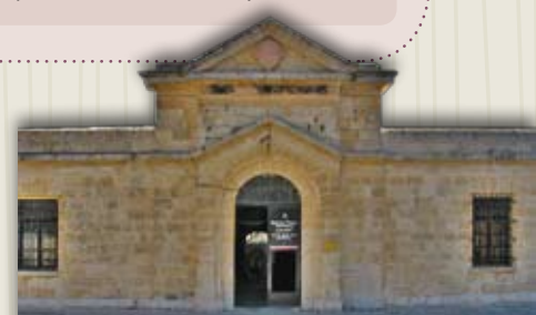
חזית מוזיאון אסירי המחטרת