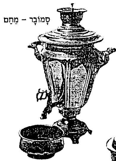
סְמוּבָר - מַחֵם

בְּעֵבֶר הִשְׁתַּמְשׁוּ לְעֵבֻדוֹת הַבַּיִת בְּכֵלֵי חָרָס, בְּכֵלֵי נְחוֹשֶׁת, בְּכֵלֵי בְּרָזֶל וּבְכֵלֵי עֵץ. בְּתַמוּנֹת שֶׁלפְּנֵיכֶם תּוּכְלוּ לְרַאוֹת דּוּגְמוֹת שֶׁל כֵּלִים שֶׁבָּהֶם הִשְׁתַּמְשׁוּ לְבִישׁוּל, לְכַבִּיסָה וּלְגִיּוּץ.