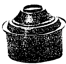
סִיד נְחוֹשֶׁת לְבִישׁוּל