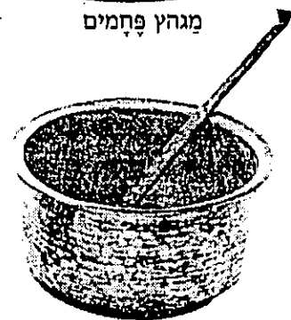
כֵּלֵי נְחוֹשֶׁת עִם מְצָקָה