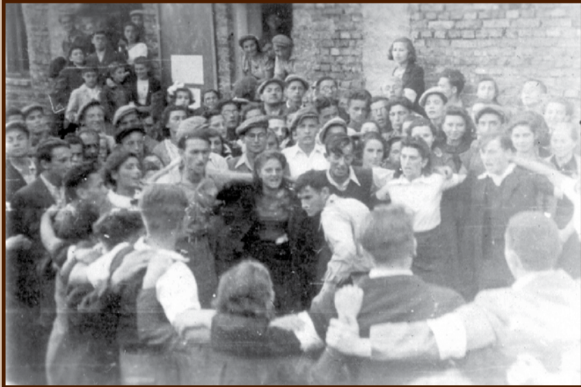
גברי הנוער הנוער בגולה הגקאית בבניין (פולין). ריקוד הורה במסיבה אציון יום האדגו של ביאליק, 1943.

מדוע הפנייה למאבק היא אל בני הנאצים? מה ניגן אצלם כדי להציל במאבק?