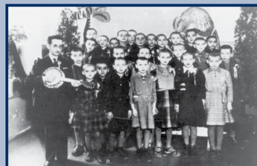
מקהלת ארזים באולווי נגן מבוצר בשטו ורשה ארכיון בית אומי הגטאות

מבא! בגמנה רמז אכך להמקפה נגנה ארזים דרך אפרזיש יופי, שמחה. במה חזר מסיילר אפם המקפה במאבק לשמור על צמח אנוש? חן פי פגלמוד חיר שאין בה מסלוג ארזים דינה אפיהרה. כיצד שמינה חן מסלוג ארזים מבטיחה גם אל חיי פמבולקרים? פוכיח! אל דבריכם מגלך פציטאיים פגליון שלפניכם.